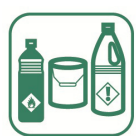
Déchets toxiques (peinture, solvants...)