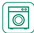
Électroménager (cafetière, congélateur...)