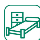
Mobilier (matelas, armoires, table...)