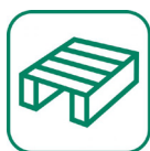
Bois (cigarettes, palettes...)