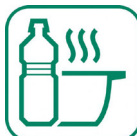
Huiles (moteur, friture...)