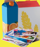
Papiers et emballages carton