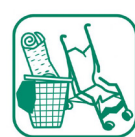
Encombrants (bâche, tuyaux...)