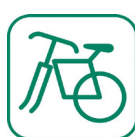
Ferraille (grillage, poêle...)