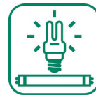
Ampoules et néons