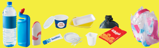
Tous les emballages en plastique : bouteilles, flacons, sacs, sachets, films, barquettes alimentaires, pots, boîtes...