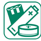
Piles et batteries