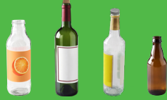
Bouteilles en verre