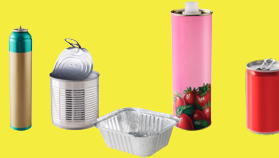
Emballages en métal, aluminium et acier : canettes, boîtes de conserves, aérosols...