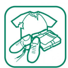
Vêtements (chaussures, pull...)