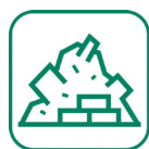
Gravats (briques, terre...)